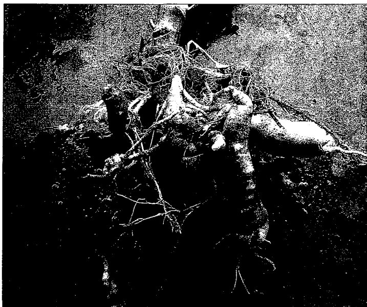
Kohlhernien an Broccoli-Wurzeln: Boniturwert 4 (s. unten). Hernie du chou sur racines de brocoli: note d'évaluation 4 (voir en bas).

Warum soll Chitin gegen die Kohlhernie etwas bringen? Obwohl der Erreger systematisch zu den so genannten parasitischen Schleimpilzen gehört, bestehen seine Zellwände zu einem